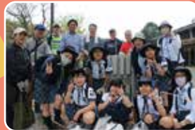
ガールスカウトとクリーン作戦

2025-26年度 RI会長／フランチェスコ・アレツツォ RI.D2590ガバナー／大塚 正一 横浜旭RC会長／五十嵐 正