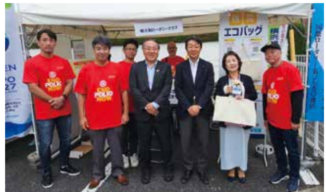
旭ふれあい区民まつりにて