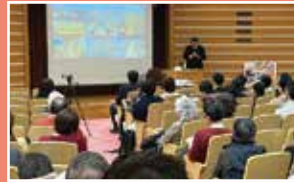
防災先進国イタリアに学ぶ講演会開催